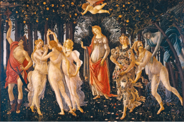
С. Боттічеллі. Весна. 1478 р.