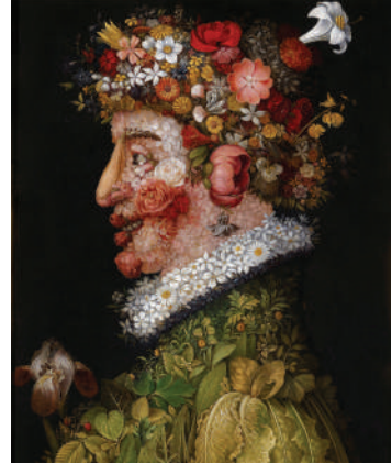
Дж. Арчімбольдо. Весна. 1573 р.