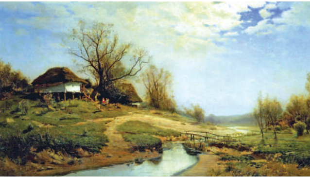
С. Васильківський. Весна в Україні. 1883 р.