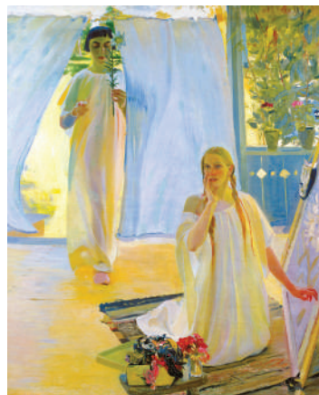
О. Мурашко. Благовіщення. 1909 р.

В архітектурі почали використовувати нові технології і матеріали: метал, бетон, залізобетонні конструкції. Класичним зраз-