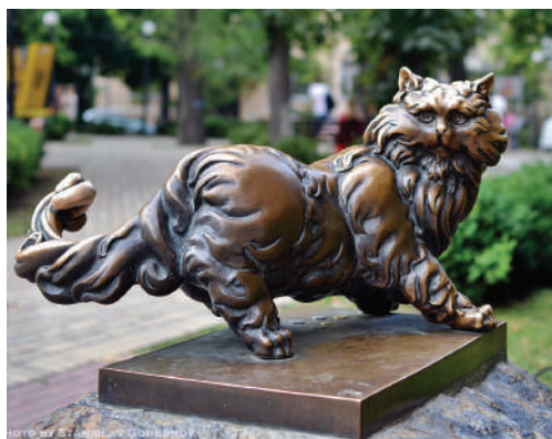
Б. Мазур. Кіт Пантелеймон. 1997 р.

6. Прокоментуйте зміст і форму мистецьких творів (усно).