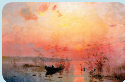
С. Васильківський. Захід сонця над озером. 1900 р.