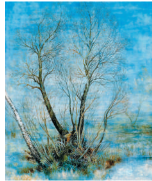
К. Білокур. Напрвесні. 1958 р.

Кожний художник змальовував весняну пору з позицій своїх естетичних уподобань і свого професійного досвіду.