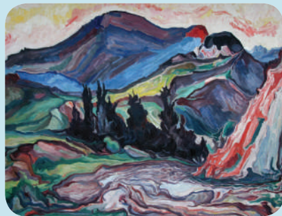
О. Новаківський. Гора Грегіт. 1931 р.

В. Стефаник, О. Турянський, Т. Осьмачка, М. Куліш ( у літературі ); О. Новаківський, В. Ласовський, В. Хмелюк ( у живописі ).