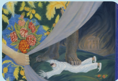
Ю. Михайлів. За завісою життя. 1923 р.