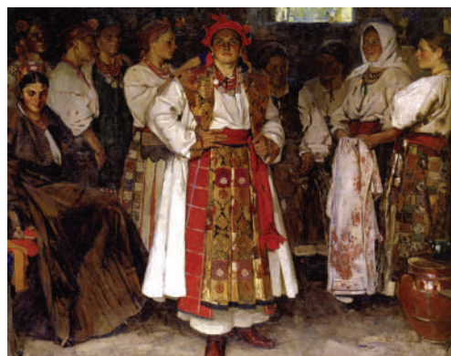
Ф. Кричевський. Наречена. 1910 р.