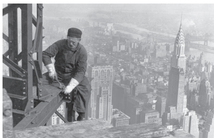
Будівництво хмарочосів у США. Початок ХХ ст.