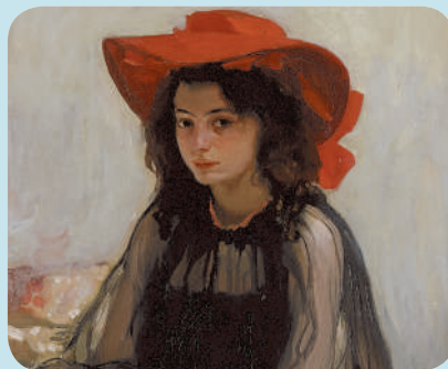
О. Мурашко. Дівчина в червоному капелюсі. 1903 р.

Леся Українка, О. Кобилянська, Олександр Олесь, Ю. Яновський (у літературі); О. Мурашко (у живописі).